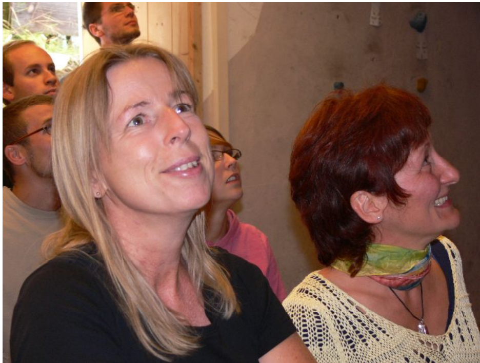
Fachkundige Zuschauer – vom Wettkampf gefesselt.