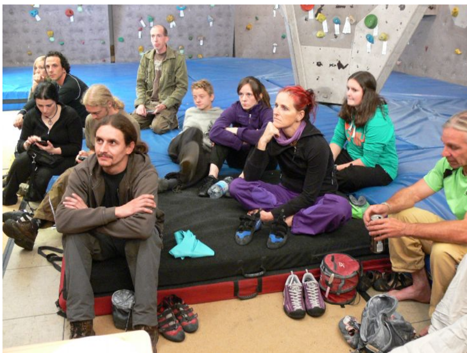
Ruhe vor dem Sturm. Teilnehmer in mentaler Sammlung.